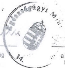
a Szakvizsgáztató Bizottság elnöke